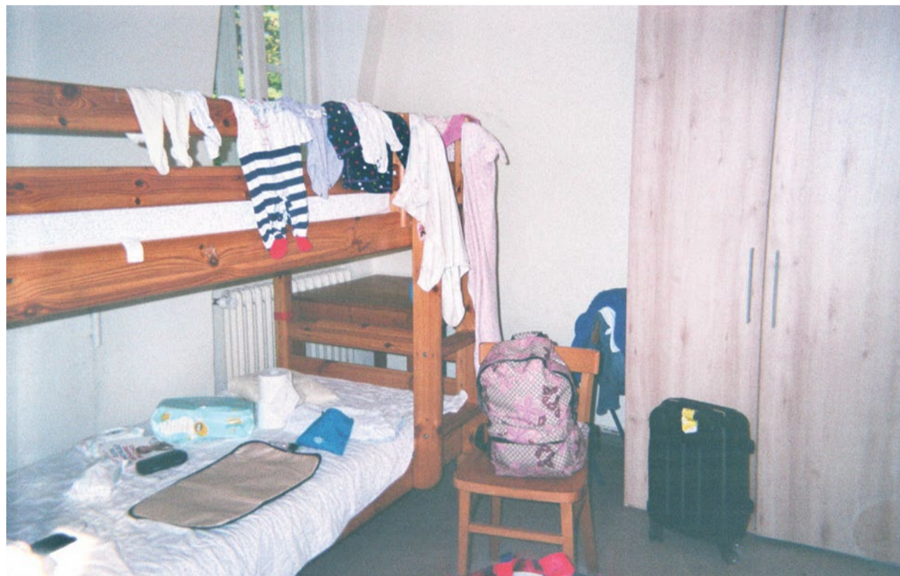
4. Oktober 2019: Das ist nicht das, was ich mir für Berlin vorgestellt hatte. Aber meine Freunde sind im August zu Besuch gekommen und haben mich einige Dinge deutlicher sehen lassen. Dinge, die ich nicht sehen wollte. Ich beschließe, einige Kleidungsstücke und Papiere mitzunehmen. Es ist schwierig, zu entscheiden, was ich mitnehmen soll. Was hat Vorrang? Für wie lange?

Die hier gezeigten Bilder stammen aus der Serie »Chronik der Reise«. Ihr zugrunde liegen Erfahrungen häuslicher Gewalt, Schwanger- und Mutterschaft und eines zeitweiligen Aufenthalts in einem Berliner Frauenhaus im Winter 2019/2020, kurz nach der Geburt der Tochter. Sofía Quesada erklärte im Interview, die Realität in der Einrichtung, in der vieles »kaputt« war, wie man auf einzelnen Bildern sehen kann, sei von starker Solidarität vor allem unter den vielen nichtdeutschen Frauen geprägt gewesen. Alle Bilder und Texte stammen von ihr. clk